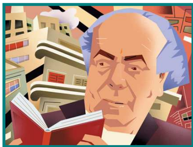
אברהם שלונסקי צייר: איציק רנט – "פרופיל תל אביבי"